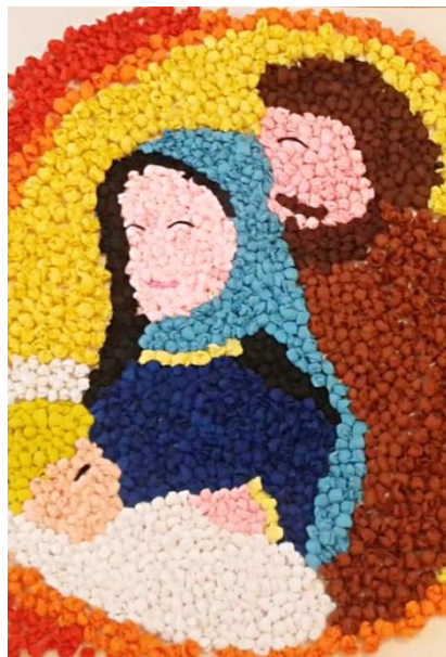
L'unione fa la forza, Resia, 2017