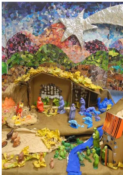
Presepi dai colòrs, 2013

Riparte l'iniziativa natalizia per dare spazio e visibilità agli anziani delle comunità dell'Alto Friuli